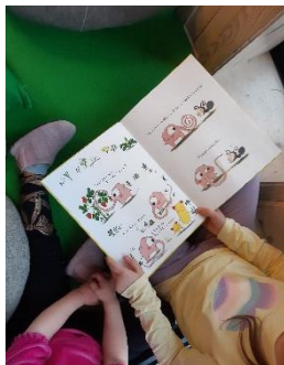
Barna leser for hverandre