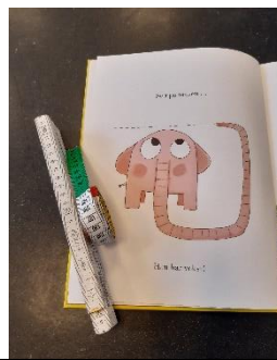
Lek og aktivitet etter lesing: Måling