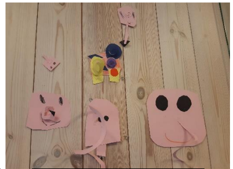
Her har barna laget Pomelo